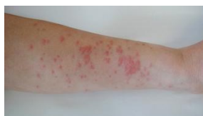
赤い発疹が広がり、つよいかゆみやはれがでる。

④手当 ひどい虫刺されだと思ったら、チャドクガに刺されたかもしれません。毒針がついているときは、セロハンテープでとりのぞきみずできれいに洗い流します。かゆみや腫れが強いので、皮膚科を受診したほうがよいでしょう。